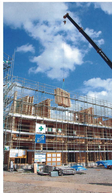
大量のパネルは、生産能力が国内最大級の工場をもつ資材会社が製作に当たった。8棟の寮建設に協力した建設会社は4社。各社の総力が結集され、6カ月という短工期を実現した。

寮は看護師の勤務体制が3交代のため、遮音対策として、界壁はグラスウールと石膏ボードの二重張りに、上下階(界床)は吊天構造で吸音効果を高める仕様とし、生活音の低減もはかっている。また、ツーバイフォー工法の耐久性も評価されたことから、長期に賃借する方式が受け入れられている。