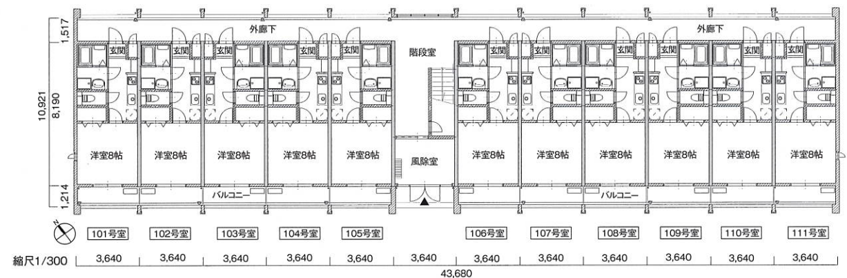
A棟1階平面図—看護師職員寮

8棟とも片廊下型で、いずれの住戸も1K、水まわり独立型。A～E棟の看護師職員寮の洋室は8帖で延床面積は29.81㎡(9坪)、F～H棟の看護師専門学生寮の洋室は6帖で延床面積は26.49㎡(8坪)。